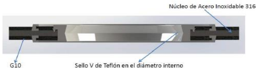
Imagen de referencia para la Empaquetadura Dieléctrica (Ítem 2)